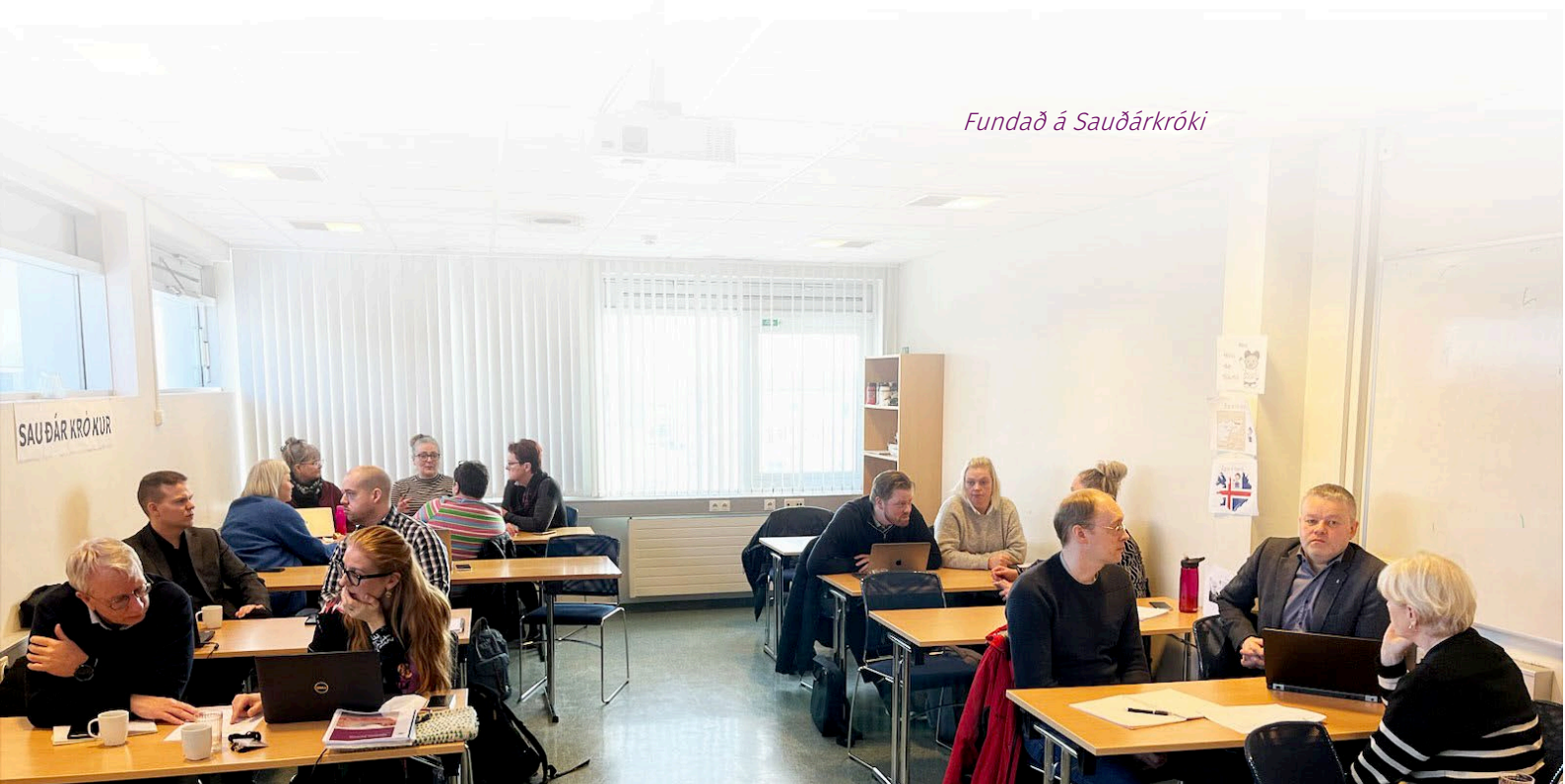
Fundað á Sauðárkróki

Í samþykktari byggðaaáætlun 2022 – 2026 kemur fram í aðgerð A 14, að styðja skuli við fundaröðina með fjárframlagi að upphæð tvær milljónir króna.