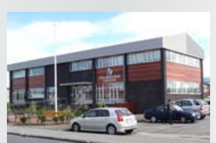
Sýslumannsembættið í Keflavík.