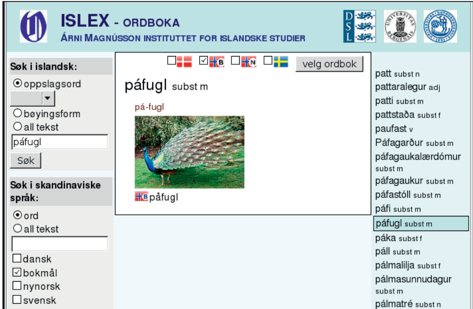
Billede 3 Bokmålsprofilen med et opslagsord.