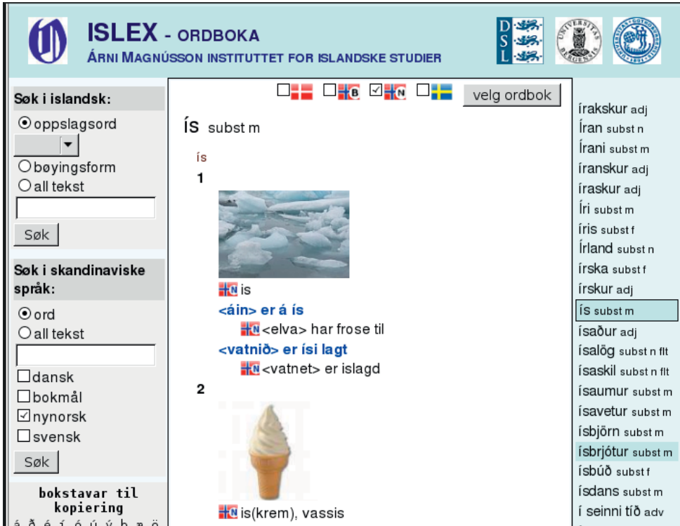
Billede 4 Den nynorske profil med et opslagsord.