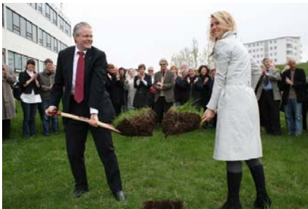
Ólafur F. Magnússon borgarstjóri og Þorgerður Katrín Gunnarsdóttir menntamálaráðherra.

Þorgerður Katrín Gunnarsdóttir menntamálaráðherra og Ólafur F. Magnússon borgarstjóri tóku fyrstu skóflustungu að nýrri viðbyggingu við Fjölbrotaskólann í Ármúla fimmtudaginn 22. maí en Reykjavíkurborg og ríkið standa sameiginlega að framkvæmdunum.