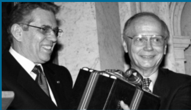
Björn Bjarnason, menntamálaráðherra afhendir Richard W. Riley, menntamálaráðherra Bandaríkjanna, heildarútgáfu Íslendingasagna í enskri þýðingu

stjórnar Íslands að gefa á sjöunda hundrað bandarískum bókasöfnum eintak af heildarútgáfu Íslendingasagna í enskri þýðingu sem út kom fyrir fáum árum á vegum Bókaútgáfunnar Leifur Eiríksson. Richard W. Riley, menntamálaráðherra Bandaríkjanna, tók á móti gjöfinni fyrir hönd bandarísku þjóðarinnar. Gjöfinni er ætlað að beina athygli að þeim menningararfi sem sögurnar geyma, um leið og hún tengist þúsund ára minningu landafunda norrænna manna í Vesturheimi.