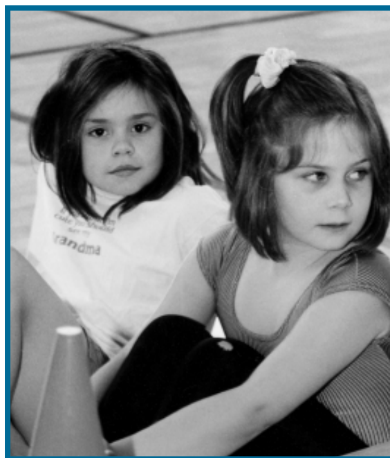
Nemendur í Hofstaðaskóla