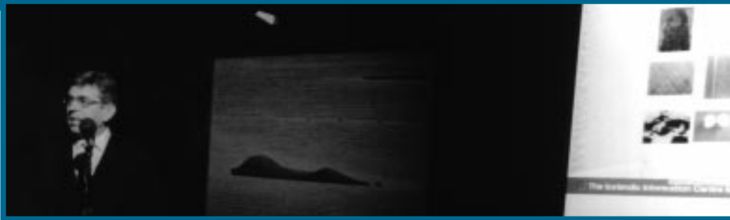
Björn Bjarnason menntamálaráðherra að opna nýjan gagnagrunn Upplýsingamiðstöðvar myndlistar

Upplýsingamiðstöð myndlistar er samstarfsverkefni menntamálaráðuneytisins, Sambands íslenskra myndlistarmanna og Myndstefs og var til þess stofnað með sérstökum samningi árið