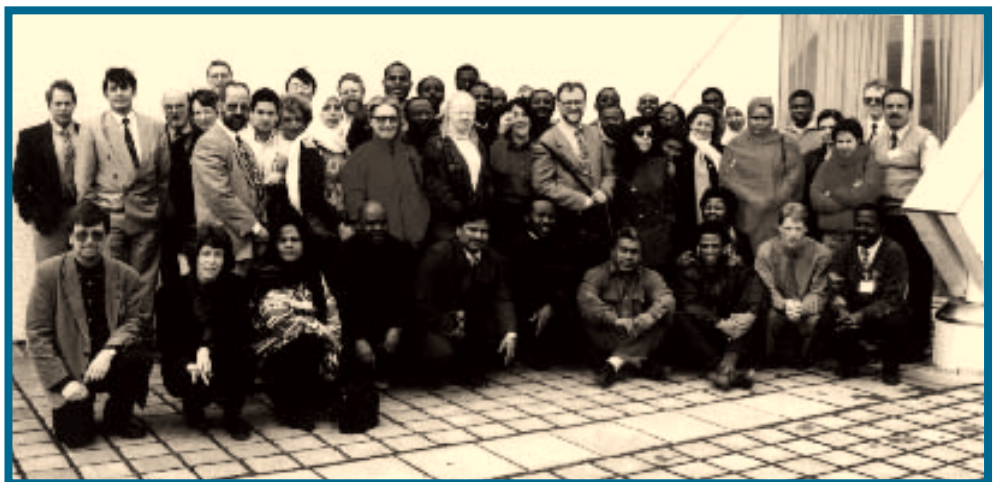
IIEP gestir fyrir utan Fjölbrautaskóla Suðurlands á Selfossi

Erlendu gestunum var boðið til menningarvöku í Listasafni Íslands. Einnig heimsóttu þeir Þingvelli og var boðið til kvöldverðar á íslensk heimili.