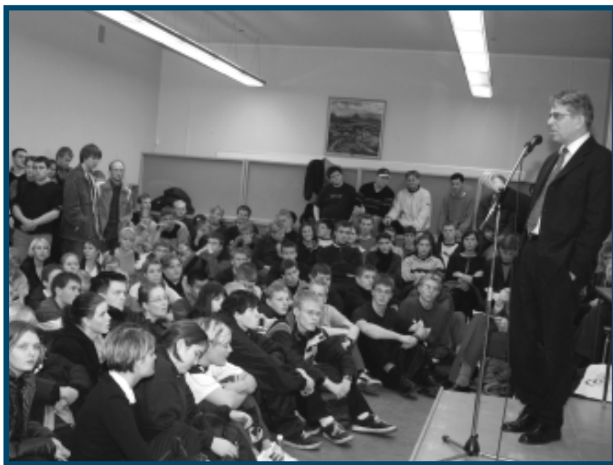
Nemendur á fundi með menntamálaráðherra í Flensborgarskóla hinn 19. janúar sl. Ráðherra mun heimsækja 28 framhaldsskóla á öllu landinu á næstu vikum í því skyni að kynna áherslur nýrrar aðalnámskrár framhaldsskóla. Sjá nánar bls. 2.

Nánari upplýsingar er að finna á heimasíðu ráðuneytisins: www.mrn.stjr.is