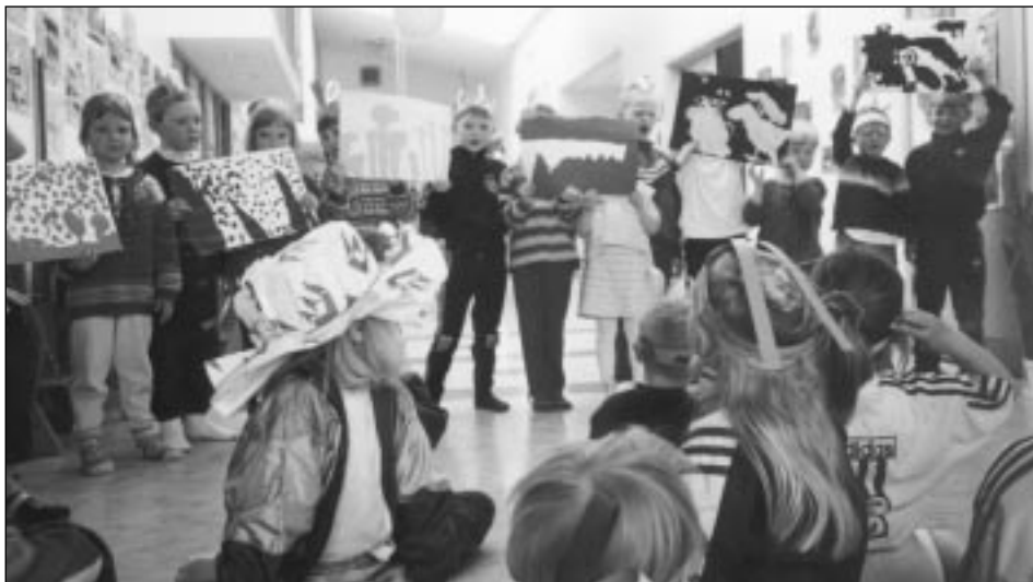
Börn í Garðaseli í heimsókn í Grundaskóla að kynna verkefnið sitt.

áætlun um hvernig mætti ná þeim. Upplýsingamiðlun milli skólastiganna var mikið rædd og áhersla lögð á nauðsyn þess að grunnskólakennarar kynntu sér starfsemi leikskólans og námið sem þar færi fram. Einkum þótti mikilvægt að fá upplýsingar um áhersluþætti leikskólans í tengslum við daglegar venjur, um þemaverkefni leikskólans og starf sem unnið er með elstu börnunum. Einnig var rætt um hvaða upplýsingar ættu að fylgja hverju barni á milli skólastiga, hvernig ætti að miðla þeim (skriflega/munnlega) og hver væri þáttur foreldra í upplýsingastreyminu. Ekki fannst endanleg lausn á þessum málum en aðilar voru sammála um mikilvægi þeirra og að upplýsingar um börnin færu eftir formlegum leiðum ef þær yrðu fastur liður í samstarfinu.