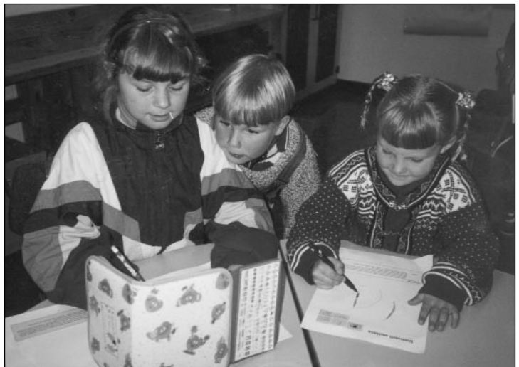
Leikskólabörn í heimsókn í Grundaskóla.

Formlegt samstarf hófst um haustið með fundi samstarfsaðila þar sem Guðlaug og Ásta lögðu fram markmið með samstarfinu og