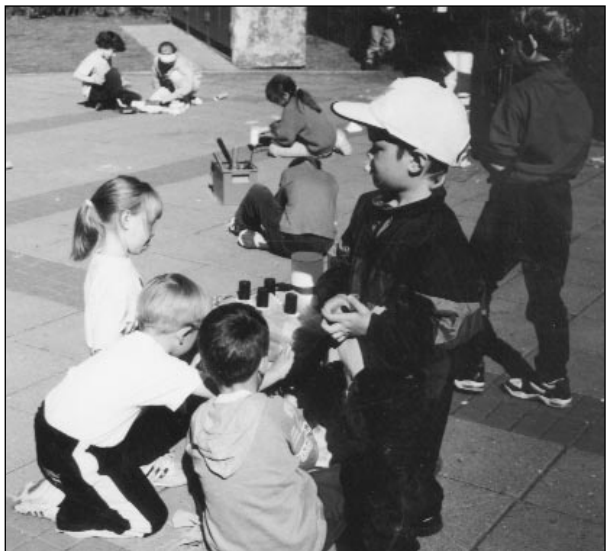
Börn í Staðarborg og Breiðagerðisskóla að búa til vináttutrollið.

Elstu börn leikskólans fara, ásamt leikskólakennara, í heimsókn í grunnskólann. Hæfileg stærð hóps er fjögur til fimm börn. Þau heim- sækja vinabekkin þar sem þau taka þátt í daglegu starfi í eina kennslustund. Í annari kennslustund sýna grunnskólabörnin þeim skólann.