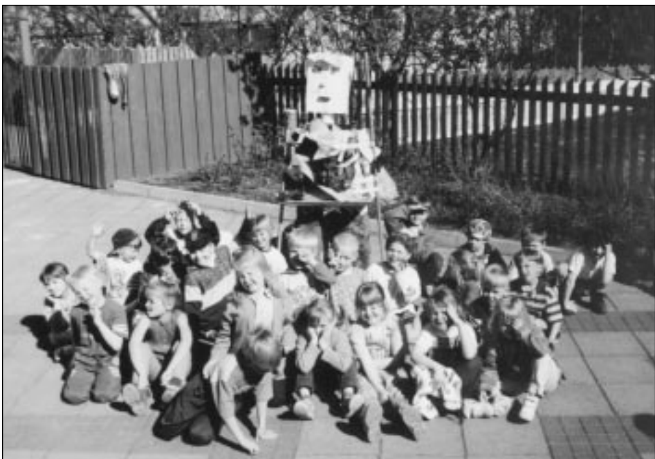
Börn í Staðarborg og Breiðagerðisskóla fyrir framan vináttutrollið.

Vinabekkur úr grunnskóla kemur í heimsókn í leikskóla. Í upphafi kynnir leikskólakennari börnunum fyrirhugað verkefni og efnivið, t.d. verðlaust efni, og biður börnin um að koma með hugmyndir að verkefnum.