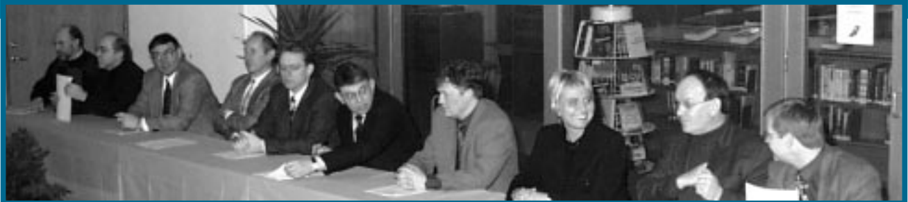
Menntamálaráðherra Björn Bjarnason undirritar samninga við fulltrúa þróunarskólanna og sveitarfélaga.

Í ritinu Í krafti upplýsinga er fjallað um nauðsyn þess að nokkrum skólum verði fengið það hlutverk að vera leiðandi um notkun upplýsingatækni í skólastarfi. Auglýst var eftir skólum til að taka þátt í verkefninu sl. vor og sóttu tuttugu og þrjú skólar um. Eftirfarandi skólar voru valdir: Árbæjarskóli í Reykjavík, Barnaskólinn á Eyrarbakka og Stokkseyri, Varmalandsskóli í Borgarfirði, Fjölbrautaskólinn við Ármúla, Fjölbrautaskóli Suðurlands á Selfossi og Menntaskólinn á Akureyri.