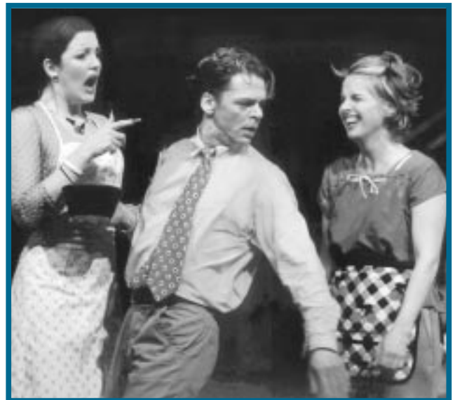
Myndin er úr sýningu Leikfélags Reykjavíkur, Sex í sveit .

Þjóðleikhússtjóri verður áfram skipaður til fimm ára í senn, en afnumið er ákvæði sem fól í sér að ekki mætti endurskipa sama mann nema einu sinni. Hins vegar verður skylt að auglýsa embættið laust til umsóknar í lok hvers skipunartímabils.