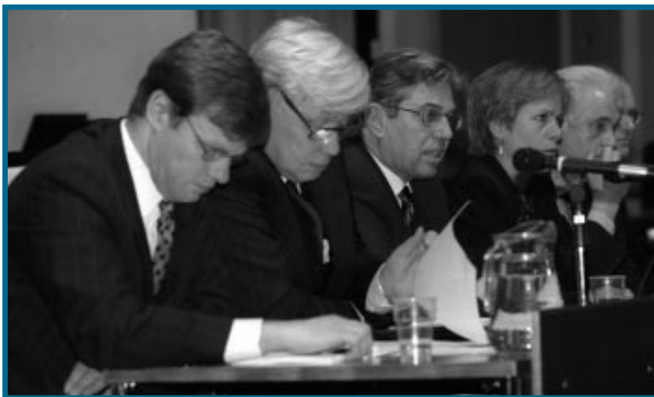
Myndin er tekin á sameiginlegum fjölmíðalafundi menntamálaráðherra, samgönguráðherra og borgarstjórans í Reykjavík.

Greinargerð VSÓ-ráðgjafar tekur mið af kröfum Artec-ráðgjafarfyrirtækisins í New York, sem hefur á að skipa sérfræðingum um hljómburð. Artec var valið eftir ábendingu frá Vladimír Ashkenazy píanóleikara en hann hefur reynslu af því að leika í bestu tónlistarsölum heims auk þess að hafa um langt árabíl hvatt mjög til þess að hér rísi tónlistarhús.