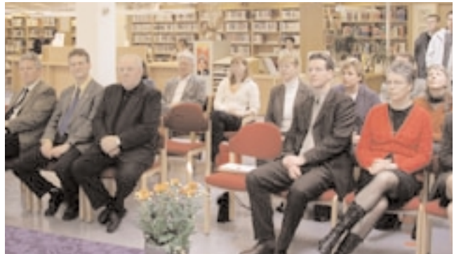
Frá undirritun samningsins í bókasafni Reykjanesbæjar

Menntamálaráðuneytið hefur átt í viðræðum við fulltrúa sveitarfélaga um uppbyggingu hins nýja kerfis. Hefur ráðuneytið lagt til að stofnað verði hlutafélag um rekstur nýs bókasafnskerfis með aðild ríkis og