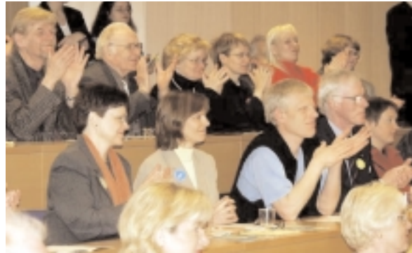
Frá opnun viku tungumálanáms í Endurmenntunarfólkun H.Í.

Jafnframt buðu sömu aðilar upp á svokölluð örnámskeið í tungumálum fyrir almenning þátttakendum að kostnaðarlausu. Voru þau mjög vel sótt. Nokkrar símenntunarmiðstöðvar voru einnig með aðgerðir þess viku, s.s. Símenntunarmiðstöð Suðurnesja sem hélt tungumalahátíð í Garði 5. maí í samstarfi við heimamenn.