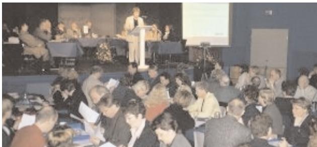
Frá ráðstefnunni Menningarlandið á Seyðisfirði

Samningur um samstarf ríkis og allra 16 sveitarfélaganna á Austurlandi um menningarmál var undirritaður við upphaf ráðstefnunnar Menningarlandið-stefnumótun menningarmála á landsbyggðinni , sem haldin var í félagsheimilinu Herðubreið á Seyðisfirði 14. og 15. maí sl. Gildistími samningsins er til ársloka 2004 og er tilgangur hans að efla menningarstarf á Austurlandi og beina stuðningi ríkis og sveitarfélaganna við slíkt starf í einn farveg. Jafnframt eru áhrif sveitarfélaga á forgangsröðun verkefna aukin. Menningarráð Austurlands verður samstarfsvettvangur sveitarfélaganna og mun meðal annars hafa það hlutverk að standa fyrir öflugu þróunarstarfi í menningarmálum, úthluta fjármagni til menningarverkefna á Austurlandi og hafa eftirlit með framkvæmd samningsins. Framlög ríkisins renna til Menningarráðs sem úthlutar þeim í samræmi við ákvörðun Alþingis um fjárveitingar. Framlög ríkisins til samningsins