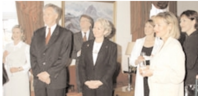
Gestir í boði ráðherra í Ráðherrabústaðnum