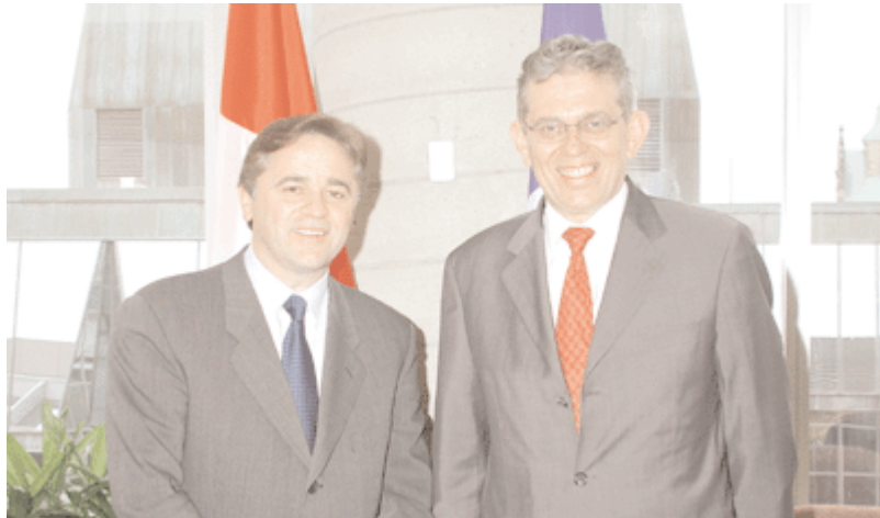
Björn Bjarnason, menntamálaráðherra, með Brian Tobin, iðnaðar- og rannsóknarmálaráðherra Kanada

Björn Bjarnason, menntamálaráðherra, heimsótti Ottawa, höfuðborg Kanada, dagana 19.-21. mars sl. Ráðherra var meðal 700 gesta á sýningu Íslenska dansflokksins í National Arts Centre í Ottawa þriðjudagskvöldið 20. mars. Með sýningunni lauk dansflokkurinn sýningarferð sinni um Kanada en flokkurinn hélt alls sex sýningar á tímabilinu 13.-20. mars. Að lokinni sýningu hélt ráðherra hóf til heiðurs dansflokknum þar sem hann þakkaði hópnum fyrir glæsilega sýningu en flokkurinn fékk mjög góðar viðtökur hjá sýningargestum.