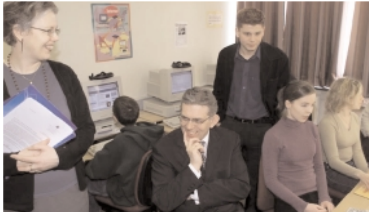
Frá opnun fréttaverkefnis þróunarskólanna www.utskolar.is í Árbæjarskóla

Hlutverk þróunarskólanna er að vinna að þróun upplýsingatækni í kennslu, námi og skólastarfi. Áhersla er lögð á breytt hlutverk kennarans með aukinni notkun upplýsingatækni í kennslu og miðlun reynslu af verkefnum sem tekist er á við. Á næstunni verður skoðað hvernig notkun á gagnasafni Morgunblaðsins var háttáð og metið hvort möguleiki sé fyrir áframhaldandi samstarfi á því sviði. Þá verður jafnframt metið hvernig fréttaverkefnið tókst með það í huga að veita fleiri skólum tækifæri til þátttöku í framtíðinni.