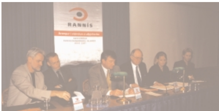
Frá pallborðsumræðunum á ársfundi Rannís 2001

Tillögurnar gera m.a. ráð fyrir því að Rannsóknarráð Íslands móti stefnu í vísinda- og tæknimálum til þriggja ára í senn. Litið verði til þess hvert sé gildi starfs á þessu sviði fyrir allt efnahagslíf þjóðarinnar. Stefnu ráðsins fylgi framkvæmdaáætlun og fjárhagsáætlun þar sem meðal annars verði tekin afstaða til starfsemi opinberra rannsóknastofnana og opinberra úthlutunarsjóða. Þá skili ráðið ríkisstjórn árléga