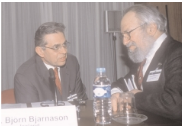
Björn Bjarnason, menntamálaráðherra, og Dr. Seymour Papert, prófessor frá MIT

Aðal umræðuefni fundarins var símenntun fyrir alla. Meginmarkmið fundarins var að meta þær framfarir sem orðið hafa í símenntun á þeim fimm árum sem liðin eru síðan ráðherrarnir hittust síðast. Fyrir fundinum lágu margvísleg gögn um stöðu símenntunar í löndum OECD ásamt greinargóðu plaggi um þau úrlausnarefni sem stjórnvöld og aðrir fræðsluaðilar standa frammi fyrir. Það er ekki síst lítil þátttaka þeirra