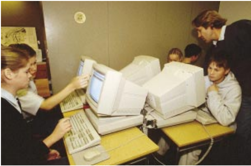
Standardiserede eksaminer i islandsk og matematik for 4. og 7. klasse blev første gang afholdt i efteråret 1996.

I slutning af det 10. og sidste år af deres obligatoriske skolegang, deltager alle elever i standardiserede skriftlige eksaminer i islandsk, matematik, engelsk og dansk. Disse eksaminer afholdes, evalueres og er organiseret af Pædagogisk Forskningsinstitut. Der gives karakterer efter skalaen 1 til 10 på basis af opgivne krav med 10 som højeste karakter. Formålet med disse eksaminer er primært at danne sig et indtryk af elevens standpunkt ved slutningen af grundskolen og hjælpe vedkommende elev med at vælge en ungdomsuddannelse. Ved slutningen af grundskolen får alle elever et eksamensbevis, der viser deres karakterer både i de standardiserede eksaminer og andre kurser, de har afsluttet i det sidste skoleår.