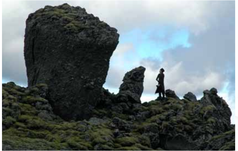
Sérkennilegir gervíggar (sappar) norðan Blængs, Vatnajökulsþjóðgarði.

Hugtakið náttúrumyndanir er ekki skilgreint með almennum hætti í náttúruverndarlögum en í 2. tölul. 1. mgr. 53. gr. eru talin upp dæmi um það hvaða náttúrufrýrbæri geti fallið undir það. Af þeirri upptalningu má ráða að hugtakið er fyrst og fremst notað um jarðrænar minjar en ekki lífræn frýrbæri. Það hefur því að miklu leyti sömu merkingu og hugtakið jarðmyndanir, sjá hér á eftir. Skýring orðsins í Íslenskri orðabók dregur fram þann eiginleika náttúrumyndana að þær skeri sig úr umhverfinu og séu einstakar. Nefndin leggur til að skilgreining hugtaksins beri þetta með sér, þ.e. að náttúrumyndun sé einstakt fyrirbrigði í náttúrunni sem að jafnaði sker sig úr umhverfinu, t.d. jarðmyndun á borð við foss, eldstöð, helli, drang, lífræðilegt fyrirbrigði svo sem einstakt tré eða gamall skógarlundur eða önnur hliðstæð náttúrufrýrbæri.