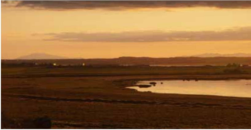
Vatnshamravatn og búsvæðavernd í Andakíl.

Hugtakið vistkerfi kemur fyrir í nokkrum greinum náttúruverndarlaga en hugtakið er þó ekki skilgreint sérstaklega í lögnum. Samkvæmt 37. gr. njóta tiltekin vistkerfi sérstakrar verndar, þ.e. votlendisvistkerfi. Eins og áður segir falla vistkerfi undir þann flokk friðlýstra náttúruminja sem fjallað er um í 3. tölul. 1. mgr. 53. gr. laganna. Vistkerfi (e. ecosystem) má skilgreina sem safn allra lífvera er hafast við í afmörkuðu rými af tiltekinni gerð, ásamt öllum verkunum og gagnverkunum meðal lífveranna og tengslum þeirra við lífræna jafnt sem ólíf-