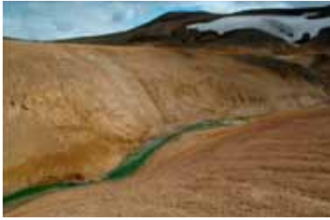
Í Vonarskarði, Vatnajökulsþjóðgarði.

svæði á láglendi þar sem beitarálag er lítið og önnur áhrif mannsins lítil sem engin. Hugtakið hálf-villt náttúra vísar til náttúru þar sem þau ferli sem ráða mestu um byggingu og starfsemi vistkerfa mótast að hluta af beinni íhlutun og athöfnum mannsins en hún heldur engu að síður mörgum upprunalegum einkennum. Orðið hálf-villt náttúra er hér notuð í sama skilningi og semi-natural í ensku. Hálf-villt náttúra liggur einhvers staðar á milli upphaflegs, náttúrulegs vistkerfis og þaulræktaðs lands, svo sem kornakra. Miðað við þaulræktuð svæði einkennist hálf-villt náttúra af því að þær tegundir sem einkenndu upphafleg vistkerfi eru að hluta eða að miklu leyti til staðar, líffræðileg fjölbreytni er meiri og jarðvegseiginleikar, yfirbragð og starfsemi vistkerfisins er miklu minna mótað af íhlutun mannsins.