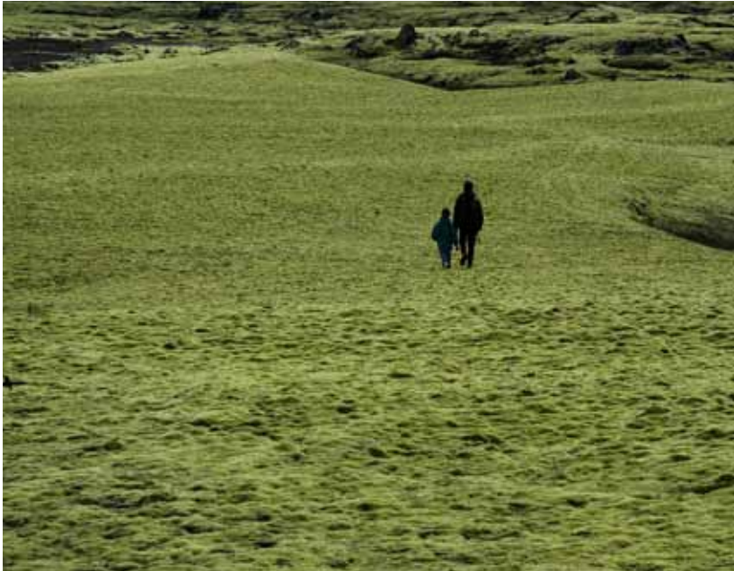
Mosabreiður við Kamba austan Skaftár, Vatnajökulsþjóðgarði.

Í samningnum um líffræðilega fjölbreytni er lykilhugtakið, líffræðileg fjölbreytni , skilgreint á eftirfarandi hátt: