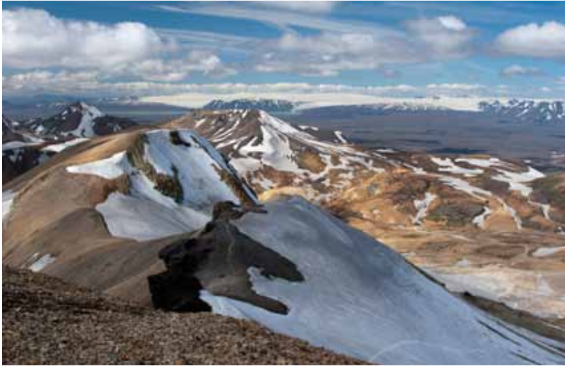
Fannborg og Mænis í Kerlingarfjöllum.

stök ákvæði um bann við akstri utan vega í þéttbýli er hins vegar að finna í umferðarlögum, sbr. 5. gr. a og er þar jafnframt áréttað að ákvæði laga um náttúruvernd gildi að öðru leyti um akstur utan vega. Af þessu má álykta að líta verði á reglu 5. gr. a umferðarlaga sem sérreglu gagnvart ákvæðum náttúruverndarlaga um akstur utan vega. Í 1. mgr. 43. gr. laganna segir að óheimilt sé að setja upp auglýsingar meðfram vegum eða annars staðar utan þéttbýlis . Vegna samspils ákvæða náttúruverndarlaga og umferðarlaga um akstur utan vega er eðlilegt að byggt sé á sömu skilgreiningu orðsins þéttbýli í þessum lögum. Leggur nefndin því til að skýring