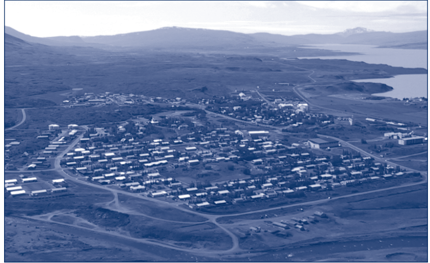
Frá Austur - Héraði

um eflingu byggðar með aðgerðum sem þessum. Félagsmálaráðuneytið hefur reynt að stuðla að fjölbreytileika atvinnulífs á landsbyggðinni sem er nauðsynleg forsenda fyrir blómlegri byggð á landinu öllu. Í dag eru innt af hendi 623 störf á