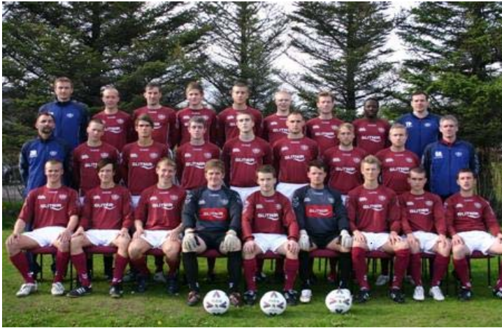
Umf. Selfoss - fótboltinn í úrvaldsdeild 2009