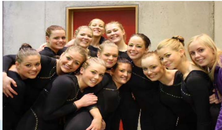
Umf. Selfoss - fimleikar, silfur á Íslandsmóti, þátttaka á Evrópumóti 2010