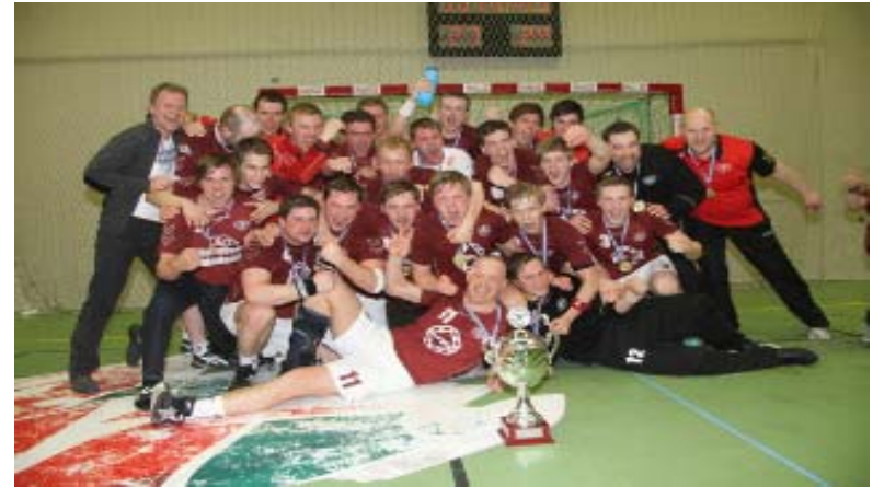
Umf. Selfoss - handboltinn í úrvaldsdeild 2010